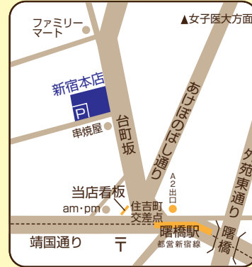
※都営新宿線曙橋駅徒歩3分