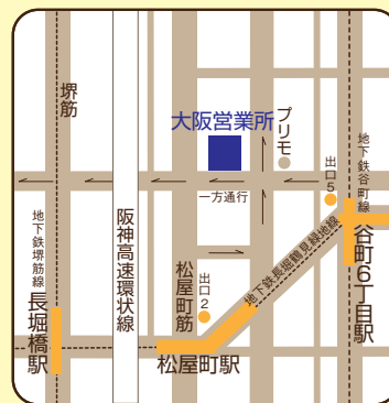
※地下鉄松屋町駅徒歩2分 ※地下鉄谷町6丁目駅徒歩6分