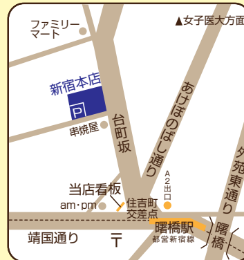
※都営新宿線曙橋駅徒歩3分